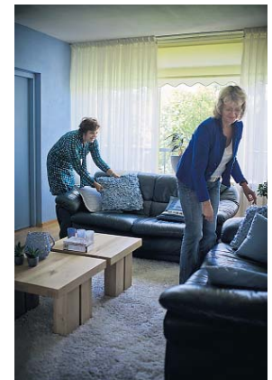
Leuke kussens met blauwaccenten maken het af.